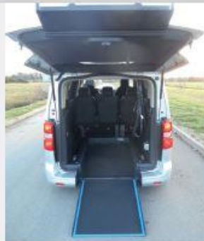
Handi'Air avec rampe courte et abaissement arrière