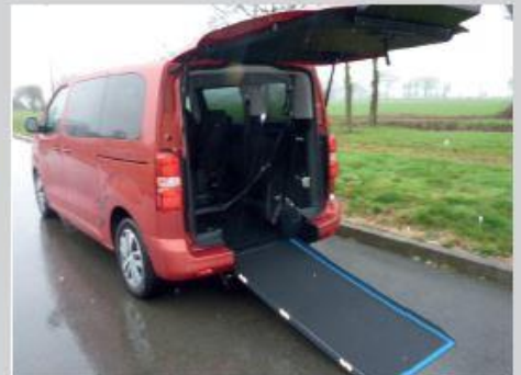
Handi'Eco avec rampe en 2 parties sans abaissement

Modulable, Polyvalent et Silencieux Convivial avec son fauteuil au plus près du rang 2 Confortable pour tous les usagers