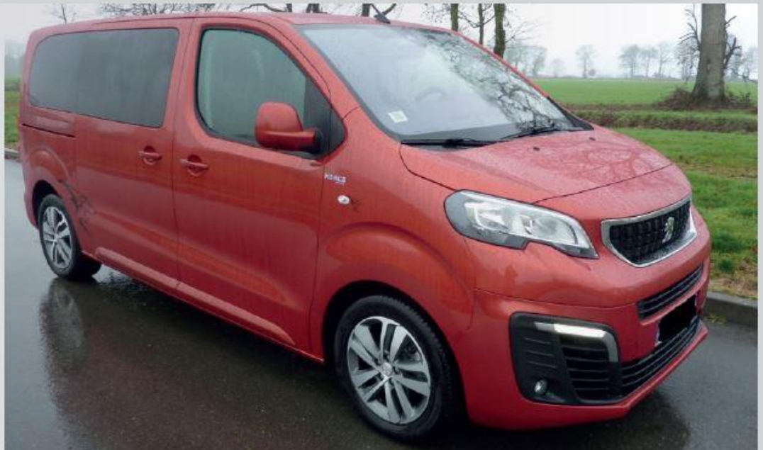
Jusqu'à 5/6 places assises + 1 place en fauteuil roulant